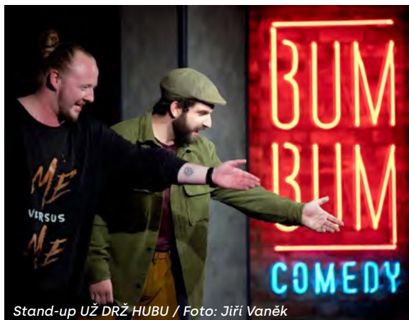
Stand-up UŽ DRŽ HUBU / Foto: Jiří Vaněk

My už se Štěpou známe opravdu dost dlouho, a máme za sebou spoustu neuvěřitelných a mnohdy i nechutných historek, které jsou vtipné, nebo aspoň nám přijdou vtipné i soudě podle reakcí diváků, kteří se zatím na náš stand-