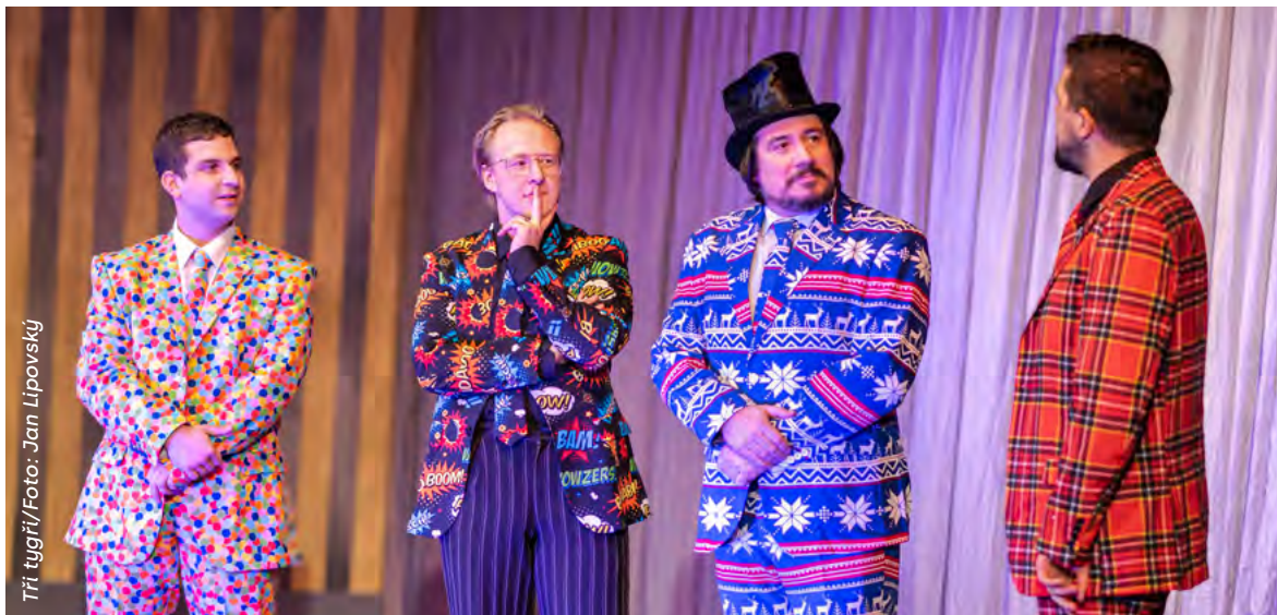
Tři tygři

up přišli podívat. Já už si přesně nepamatuji, jak to vzniklo, ale jednou jsme takhle seděli po té Štěpánové tour v O2 Aréně, a řekli jsme si, že bychom mohli vytvořit takový stand-up, nebo komponovaný večer, kde bychom říkali tyto naše historky ze společného života. Vyzazili jsme s tím na tour po různých českých městech, kde se nám to osvědčilo, že to funguje. V prosinci otevřel Štěpán svůj stand-up klub BUM BUM COMEDY, tak jsme si řekli, že by to mohlo fungovat i tam. V lednu máme 6 představení a následně by se to mělo minimálně každý měsíc 2x opakovat. Zatím je to do konce sezóny vyprodané, za což jsme rádi.